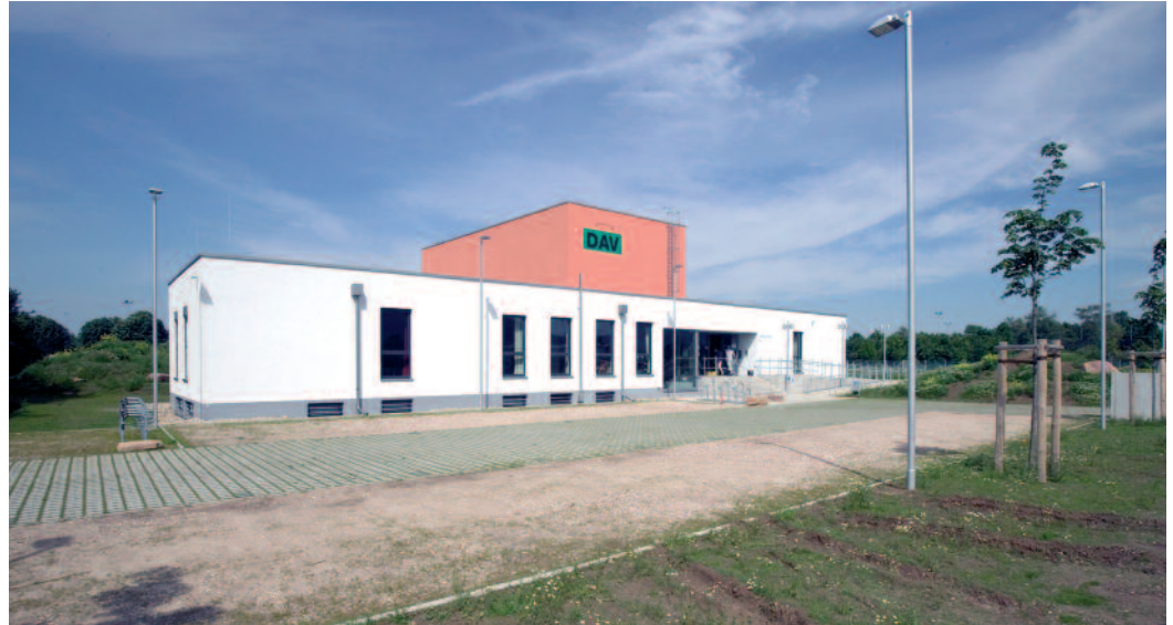
Kletterhalle: Die Sektion Heidelberg des Deutschen Alpenvereins konnte endlich ein neues Domizil mit Kletterhalle im Westen Heidelbergs beziehen

Die Inszenierung der Kletterhalle spielt schon im Eingangsbereich über eine ihr frontal zugeordnete Öffnung die wesentliche Rolle. Eine vornehme Treppe, in dem an sich aus Budgetgründen einfach gehaltenen Bau, führt in das Untergeschoss, das eigentlich keines darstellt. Ein direkt angegliederter, nach Westen orientierter, geräumiger Tiefhof lässt es zu einem zweiten Erdgeschoss werden. Hier entwickelt sich mit Be-