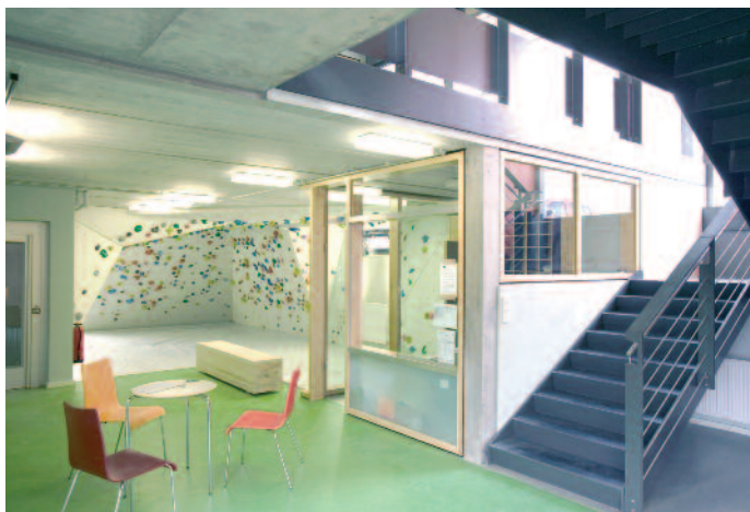
Kletterhalle: Aus Budgetgründen wurde der Neubau auf das Notwendigste reduziert, ohne jedoch darunter zu leiden

zug nach draußen ein kleiner Aufenthaltsbereich, die Boulderzone und die zentral gelegene Informations- und Kontrollstelle. Die Kletterflächen in der Halle und im Boulderbereich umfassen ca. 800 m 2 mit den unterschiedlichsten Schwierigkeitsgraden bis hin zur „neun plus“. Im Außenbereich besteht im Tiefhof die Vorhaltung für eine weitere Kletterwand.