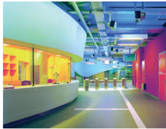
Heidelberger Bergbahn: Modern und futuristisch präsentiert sich die sanierte Station am Kornmarkt

in der Stadt und Aspekte der denkmalpflegerischen Aufbereitung.