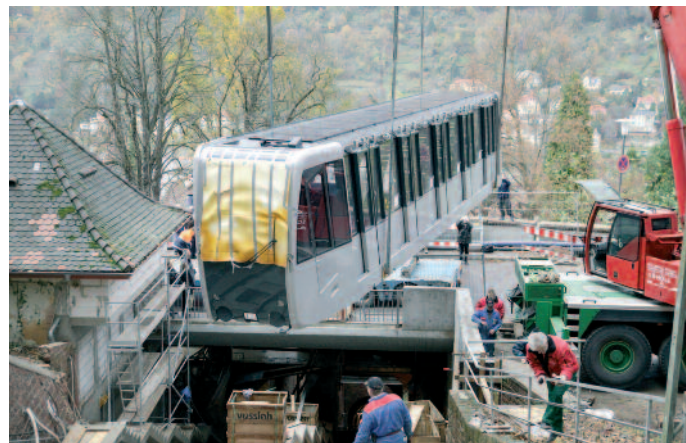
Heidelberger Bergbahn: Eine technische Kraftanstrengung war der Einsatz der neuen Bahn am Berg

durch immer weitere Umbauten und Veränderungen der Umgebung bei der Talstation. Der aktuelle Umbau, initiiert durch die Forderungen zur moderneren Bergbahntechnik, hatte mehrere Vorgaben zu erfüllen: die Stärkung der funktionalen Unterstützung des Bahnbetriebes, das Ermöglichen einer Fahrgaststeigerung in Spitzenzeiten, eine behindertengerechte untere Sektion, die bessere Verankerung und Auffindbarkeit der Stationen